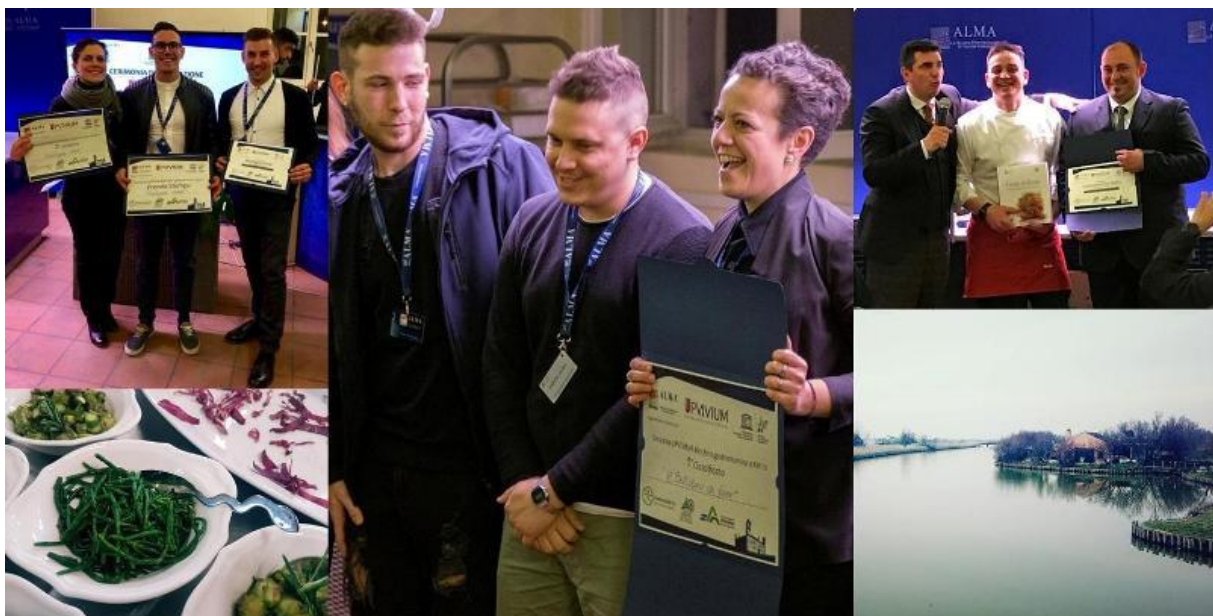
I primi tre classificati a livello nazionale della scorsa edizione del concorso "Upviviium: Biosfera gastronomica a km 0"

Le Riserve di Biosfera provvederanno a pubblicare la graduatoria del concorso ed i vincitori sul sito internet dell'iniziativa e sui loro strumenti di comunicazione.